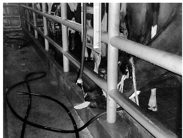
図1 ホースから漏れる水に舌を伸ばす牛 (平成23年5月:帯広食肉衛生検査所所管と畜場で)