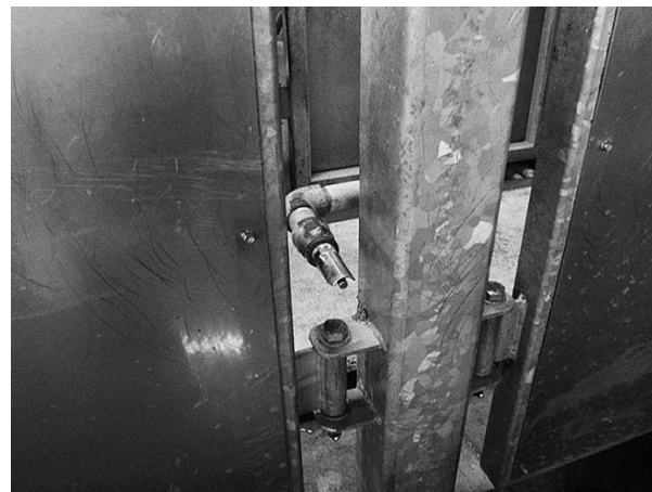
図3 豚用飲用水設備(ニップル)